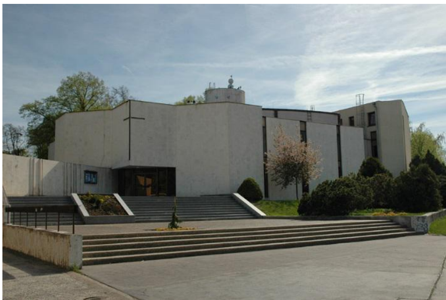
Budova sboru CASD Praha – Smíchov, kde se konalo finále soutěže dne 17. 11. 2015.