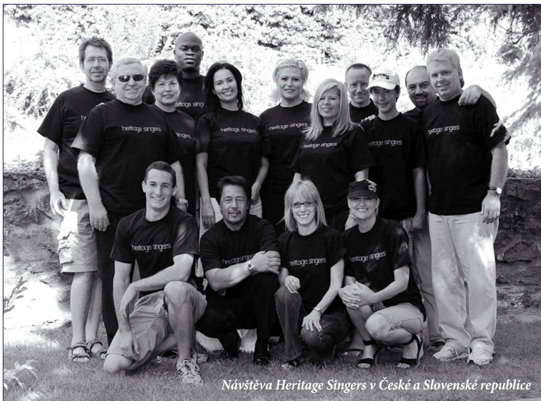
Návštěva Heritage Singers v České a Slovenské republice