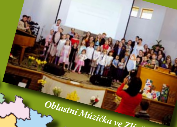
Oblastní Múzička ve Zlíně