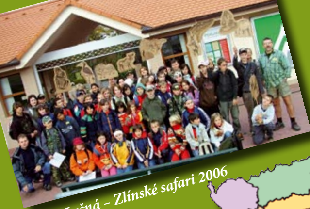
ZOO Lešná - Zlímské safari 2006