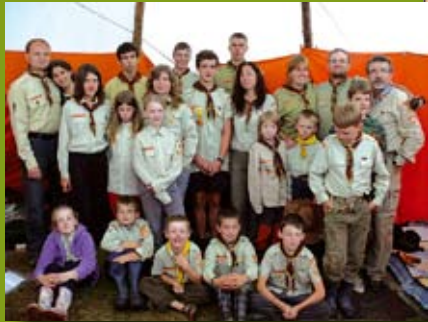
Tábor Veselí na Moravě