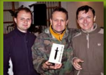
První a poslední oblastní vedoucí s Framem